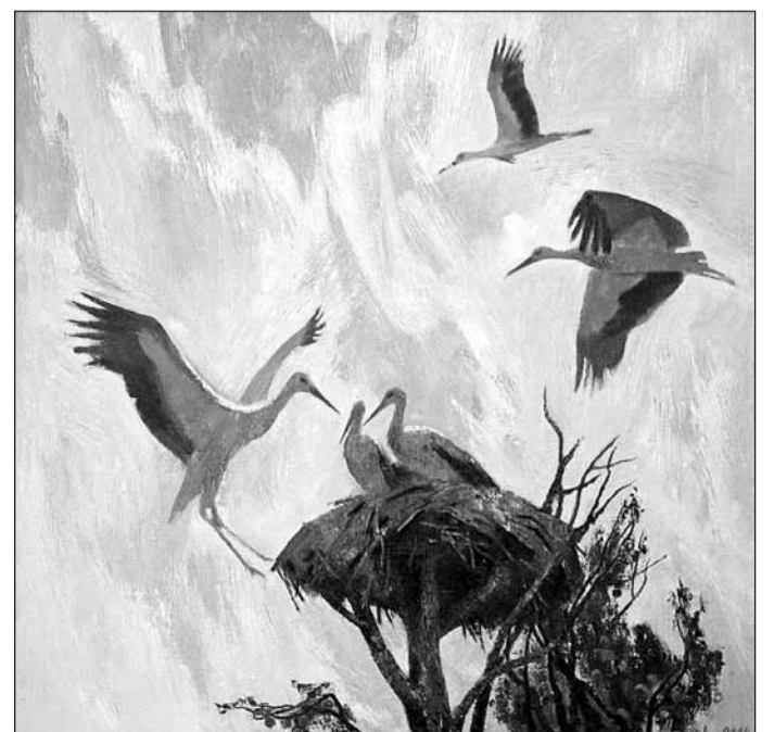
«Солнечные птицы». 2004 г.